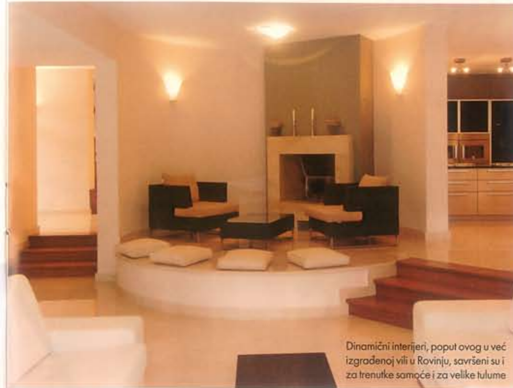
Dinamični interijeri, poput ovog u već izgrađenoj vili u Rovinju, savršeni su i za trenutke samoće i za velike tulumе