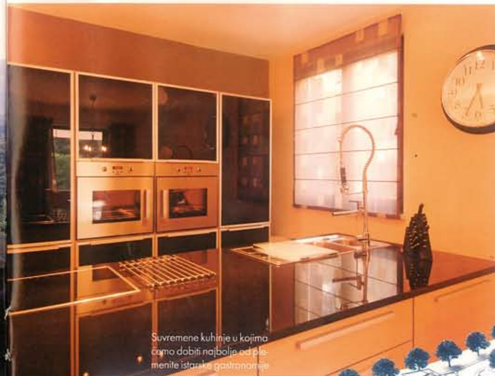
Suvremene kuhinje u kojima ćemo dobiti najbolje od plemenite istarske gastronomije

Rezidencijalno naselje Astorea u Baderni pokraj Poreča (vizualizacija na slici desno) izrazito je humano: na kvadrat stambenoga prostora dolazi kvadrat zelenila! Gradnja je kvalitetna, a ugradbeni i izolacijski materijali zdravi i k tome štede energiju. U Astoreji je riješen i problem održavanja stana, pa čak i opremanja stana namještajem i uređajima - tako da ničime ne trebate razbijati glavu i ometati si užitak na svojem istarskom ladanju!