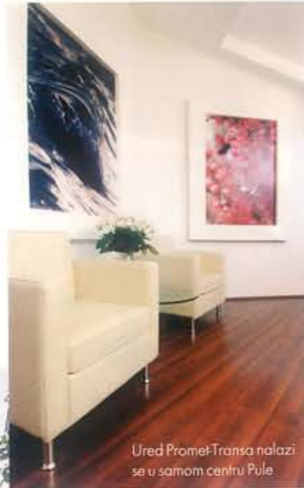
Ured Promet-Transa nalazi se u samom centru Pule

Tko ne bi volio chillati u avako slikovitom istarskom pejzažu!?